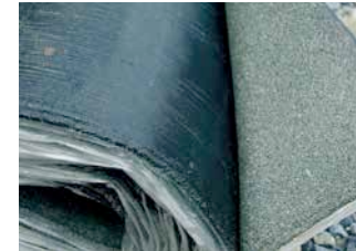
Bitumierte Dachbahn (Roofing)